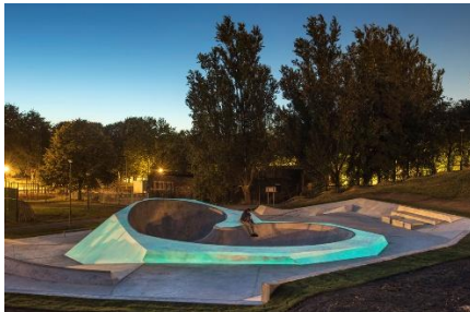
For Children. Art Stories since 1968

Rivane Neuenschwander in collaboration with Guto Carvalhoneto The Name of Fear/Vaduz (Enge Räume/People in Disguise) , 2021 (Baumwolltwill, Polyester, Steppwatte, PVC, Knöpfe | Cotton twill, polyester, quilt batting, pvc, buttons) 98 x 92 x 10 cm