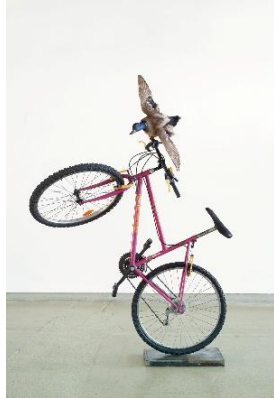
ars viva 2025. Wisrah C. V. da R. Celestino, Vincent Scheers, Helena Uambembe

Vincent Scheers The history of the criminal , 2021 (Mountainbike, gefundene präparierte Ente, Stahl | mountainbike, found taxidermy duck, steel) 180 x 120 x 40 cm