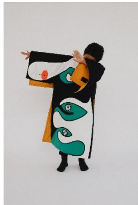
ars viva 2025. Wisrah C. V. da R. Celestino, Vincent Scheers, Helena Uambembe

Vincent Scheers The history of the criminal , 2021 (Mountainbike, gefundene präparierte Ente, Stahl | mountainbike, found taxidermy duck, steel) 180 x 120 x 40 cm